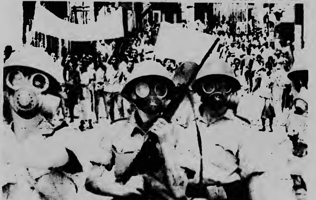
Cu mascara di gas rita nan cura, soldanan patrumero di ehército britanico ta camina cu bayanan di Aden e dianan aki caminda terrorismo y violencia a lanta cabes di un manera espantoso, muriendo cada dia mas y mas hende. E manifestacionnan violento ta ser inspira door di e Nacionalistanan Arabe cu ta agita poblacion di e pais chikitu aki.